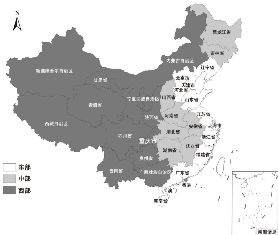
图 1.1 我国东中西部区划示意图